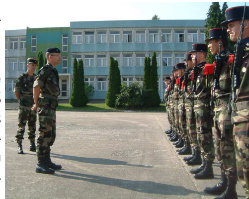
Le général et le chef de corps devant le piquet d'honneur

En fin de journée, le général de VILLIERS a souligné auprès de tous son excellente impression du régiment, qu'il visitait pour la première fois. Une