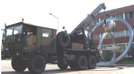
L'Astroboule harnaché sur son ancien emplacement