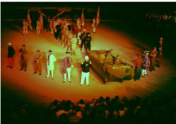
Les théâtres vivants présentés aux arènes n'ont pas manqué de réjouir les spectateurs