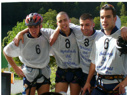
L'équipe du 1er RAMa