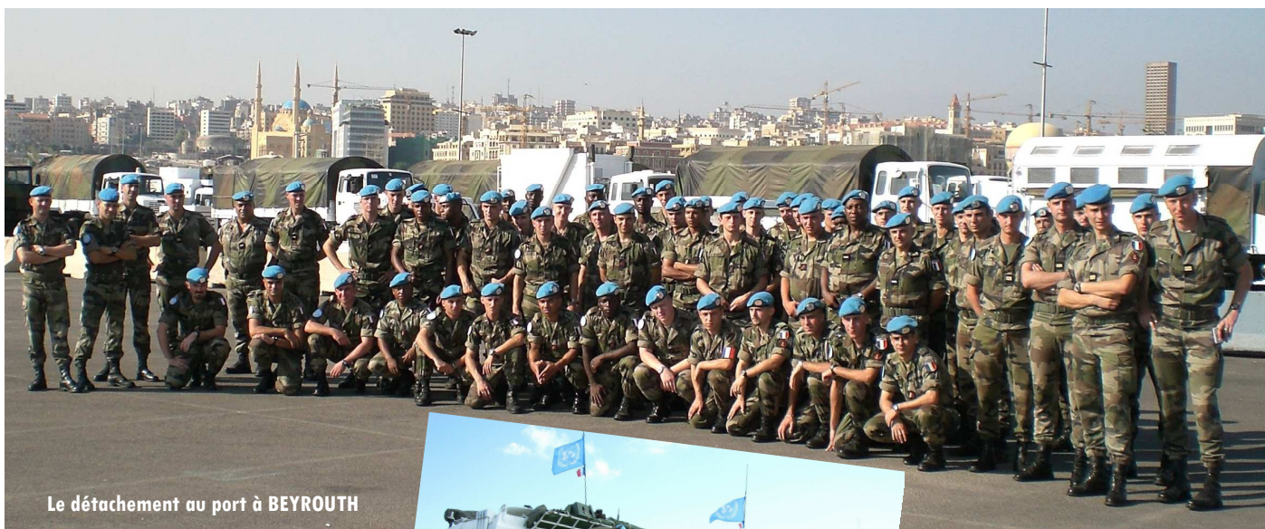
Le détachement au port à BEYROUTH

Au niveau du régiment, cette mission a été l'objet de la projection d'une centaine d'hommes et notamment de 4 AUF1. Nos bigors, arrivés sur place, n'ont pas tardé à donner de leurs nouvelles. Bérêts bleus et