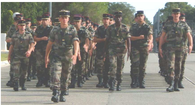
Les bigors de la 4 s'avancent sur la place d'armes du 21e RIMa

ont fait la gloire des Troupes de Marine.