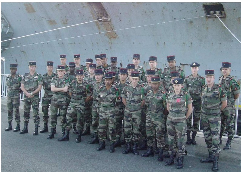
La section VIGIPIRATE de l'ADJ LECAS au complet

Travaillant de manière autonome et dans un environnement géographique superbe, les bigors ont contribué à la surveillance des criques lors des passages des sous-marins. Profitant