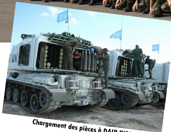
Chargement des pièces à DAIR KIFA

Le dispositif du GTIA 1 déployé au Liban dispose de capacités lui permettant d'assurer à la fois des missions de contrôle de zone (composante infanterie), tout en fournissant une réserve opérationnelle de théâtre (artillerie, chars) au commandant de la force, visant à