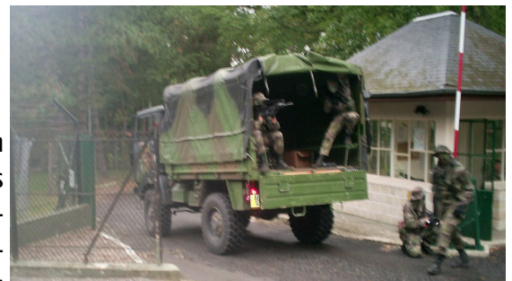
La section report. Mission accomplie!

Une fois les gardes maîtrisés, un groupe assure l'entrée du site afin de laisser s'introduire le gros de la section. Ensuite, un deuxième groupe sécurise tous les abords du bâtiment principal. Enfin, le dernier groupe investit le bâtiment de commandement dans le but de saisir des documents confidentiels. La section s'est ensuite exfiltrée à l'abri d'un écran de fumigènes.