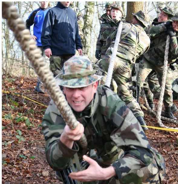
Franchissement d'un terrain miné avec sac et FAMAS : quand la tête veut...

Les élections présidentielles ménapiennes du 25 août 2005 contrôlées par la communauté internationale ont été déclarées conformes. L'Union Européenne a proposé sa médiation début 2006, mais a reçu une fin de non recevoir. Le 10 septembre, le conseil politique de l'UE approuve le plan 1021 et