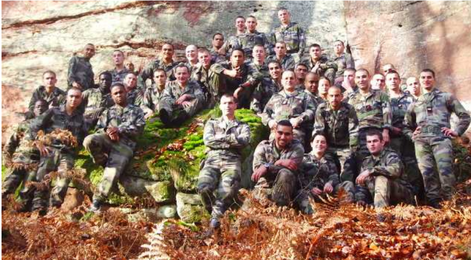
Les bigors de la 1 ère Batterie présents pour la MCO à Bitche

Une marche de 30 km a parfait le renforcement moral de tous en s'atta-