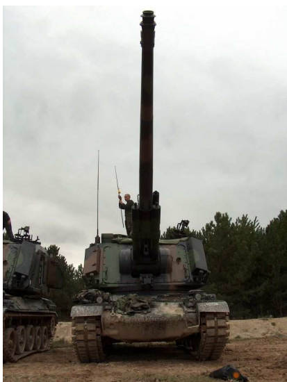
Il aura fallu tenir bon pour assurer la maintenance des machines

Même si la préparation technique d'un tel déploiement se fait de façon anticipée, les difficultés rencontrées dans la chaîne maintenance ont laissé pendant toute la durée du camp, une marge de manœuvre limitée. Quelque soit la catégorie de matériels, il y avait obligation de résultat dans les réparations, ne disposant pas de véhicules de substitution. La veille des contrôles opérationnels, deux AUF1 sur six étaient disponibles. L'objectif était fixé à cinq.