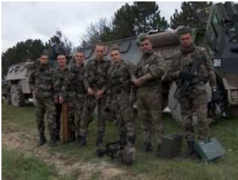
Un groupe de la 2 e Batterie en section mortier prend la pause devant les VAB

heure, respectant de façon précise les quantités et types planifiés par le