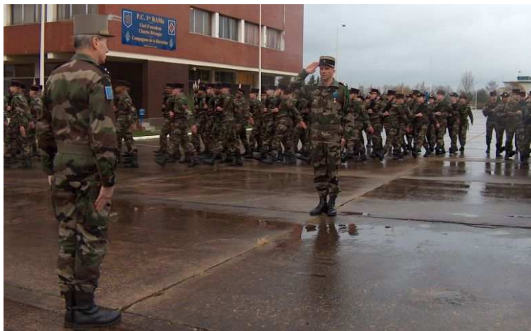
Le général a été salué par un défilé régimentaire

La journée sera bien remplie : présentation des chefs de service, entretien avec le chef de corps et exposé de présentation du régiment auquel succéderont les