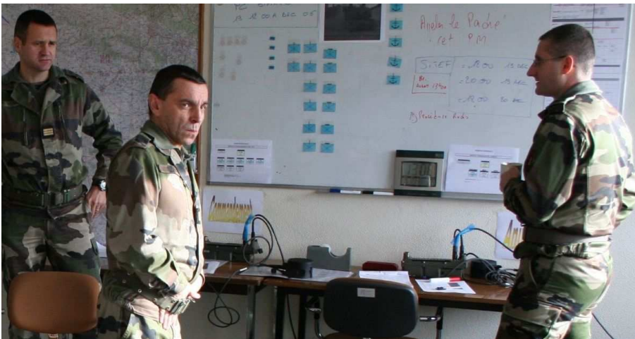
Le BOI a contribué pendant 48 heures à gérer et à animer l'exercice depuis le PC du BOI, en coordination avec les actions des hommes sur le terrain, plongés dans le scénario de l'exercice.

Dans le cadre de leur mise en condition opérationnelle, les modules tournants du 1 er régiment d'artillerie de marine ont été contrôlés lors d'un exercice régimentaire qui s'est déroulé dans la région de Couvron, les 19 et 20 décembre 2006.