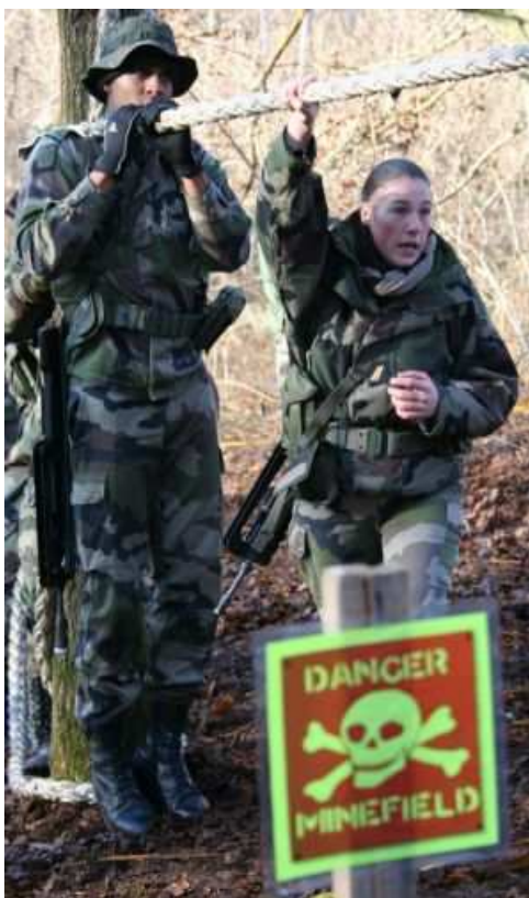
Qui tient le haut de la corde tient la vie de son camarade...

Sur le site de Samoussy, le CNE DENISART organise le filtrage des passages sur la route et installe un dispositif de premier accueil des ressortissants et candidats à l'évacuation. Ce n'est pas sans compter la présence de miliciens locaux, armés et instables, dont il faut contrôler les allées et venues.