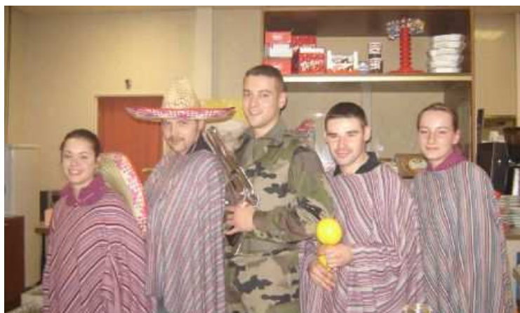
Le soir où les Mexicains ont révolutionné le cercle mess...