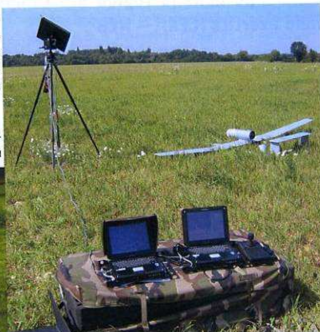
Le DRAC nécessite un équipement adapté: il permettra de renforcer les compétences opérationnelles du régiment.