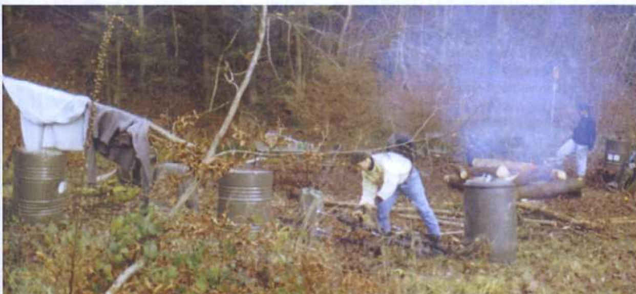
Un faux campement d'orpailleurs a été établi pour l'exercice

Lors de leur dernière sortie terrain, une marche de 32 kilomètres a permis aux stagiaires de se préparer physiquement