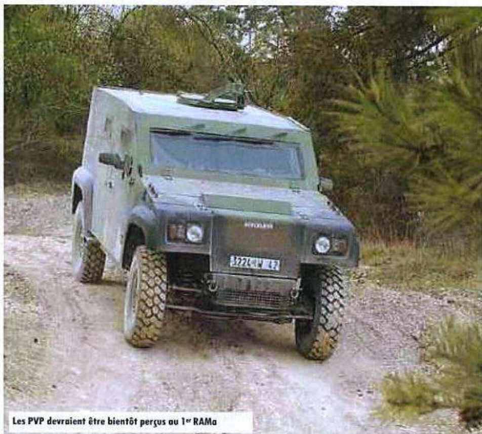
Les PVP devraient être bientôt perçus au 1 er RAMa

Dans le cadre de la montée en puissance de la Batterie de Renseignement de Brigade (BRB), la section ROHUM (Renseignement d'Origine Humaine) poursuit sa formation.