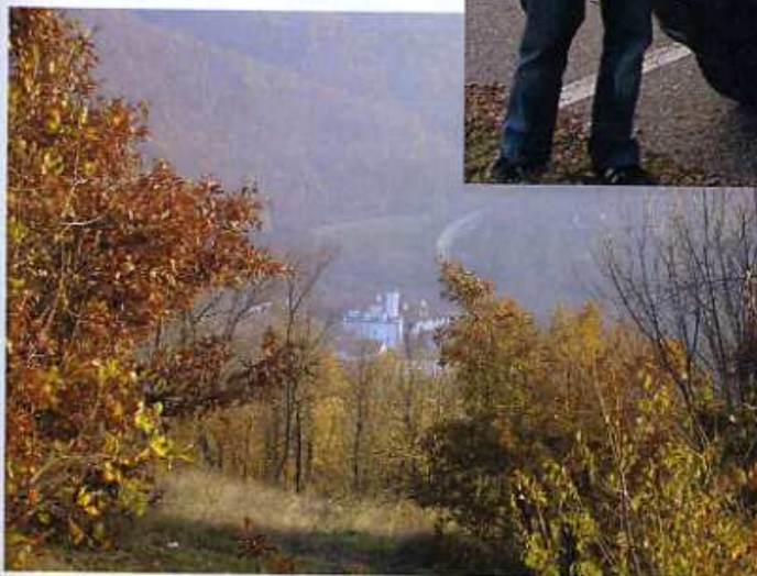
Un monastère serbe près de la frontière avec FYROM

patrouiller dans notre zone de responsabilité pour rendre compte de l'évolution de la situation politique et sécuritaire.